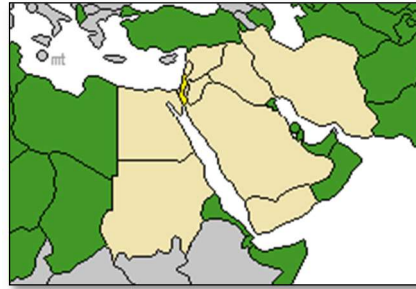
الدول المذكورة في النبوءات ملونة بالبيج

كما يتضح من الجدول ، يتنبأ الكتاب المقدس للعديد من هؤلاء الناس أنهم سيعبدون الله حقًا. يعطي الرسم التوضيحي التالي انطباعًا عامًا عن موطنهم فيما يتعلق بالحدود الحالية. من اللافت للنظر أن شبه الجزيرة العربية ، مهد الإسلام ، وجزء كبير من العالم العربي مدرجة.