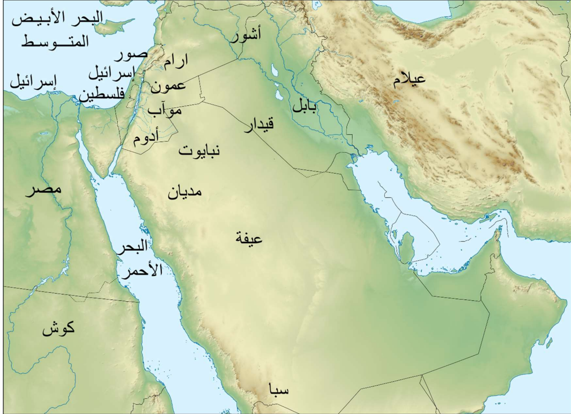
عدد من الأمم المذكورة في النبوءات

الكتاب المقدس ليس فقط كتاب اليهود والمسيحيين ؛ أنه يحتوي على رسالة لجميع الناس على الأرض كلها. وهذا واضح من وعد الله لإبراهيم "فيك تتبارك جميع قبائل الأرض". ١ إلى جانب هذا الوعد العام وغيره ، أعطى الله لأنبيائه رسائل محددة تتعلق بأمم معينة. هذه تتعلق بالدول المجاورة لإسرائيل ، مثل عمون وموآب وفلسطين (فلسطين القديم) ، وممالك عظيمة مثل مصر وآشور وبابل.